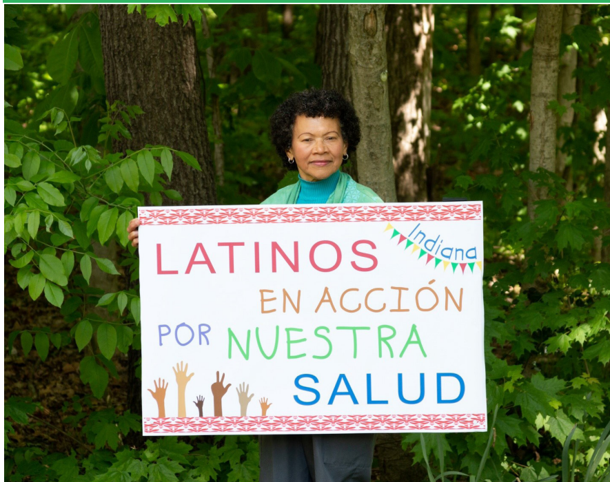
Fotografía: Eduardo Isidro Photography & Video///Diseño de poster: Yllari Briceño